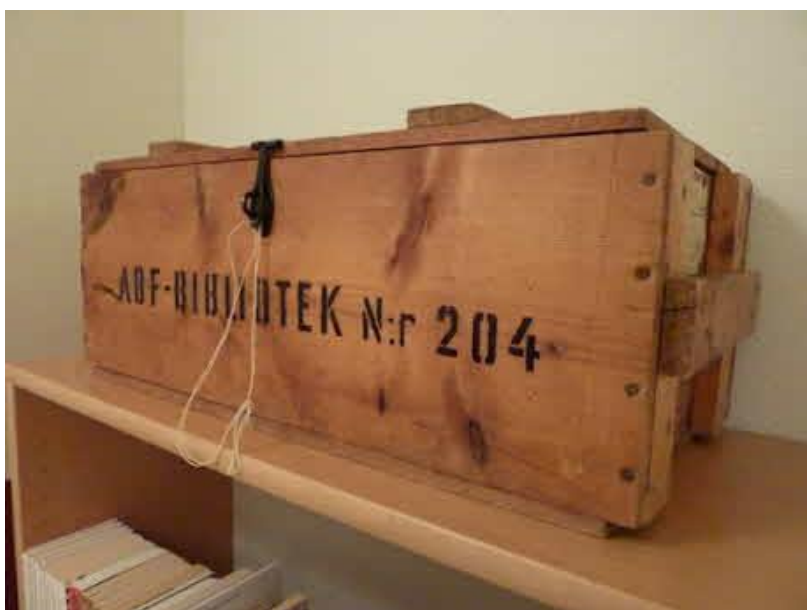
Stadsbud anlitas för att flytta vandringsbibliotekens trälådor.

Från Stockholm kan vi bege oss till sågverkssamhället Holmsund, vid Umeälvens mynning där väckelserörelsen var stark. Dess medlemmar opponerade mot husförhörens auktoritära katekeslärande. För de frikyrkliga var läsningen mer en form av begrundan. Det gällde att ta till sig det lästa, samtala med likasinnade över det budskap texten tänktes innehålla och ”gömma det i sitt hjärta”. Detta sätt att läsa - att samtala med sig själv och andra om textens innebörd - kom även att genomsyra fackföreningarnas, nykterhetslogernas och den politiska arbetarrörelsens sätt att läsa.