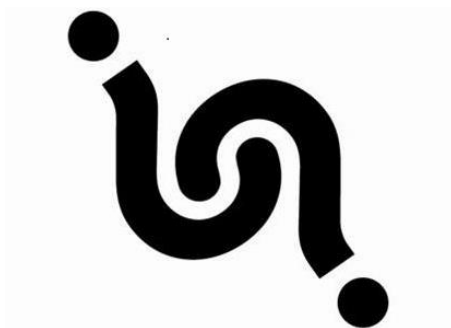
Figur 1. Symbol för tillgänglighet och användbarhet för personer med nedsatt kognitiv förmåga. 6